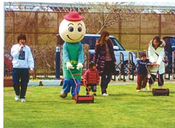
緑の子育てボランティア