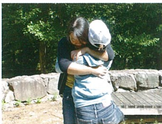
きょうだいのためのプログラム