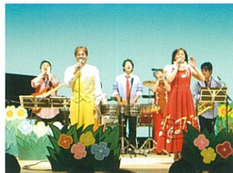
ゆめいっぱいコンサート